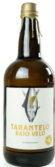
TARANTELO BAJO VELO