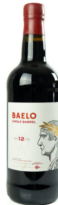
BAELO SINGLE BARREL