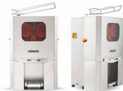
EASY-PRO Z SS