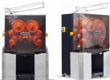
EASY-PRO Z BLACK EDITION